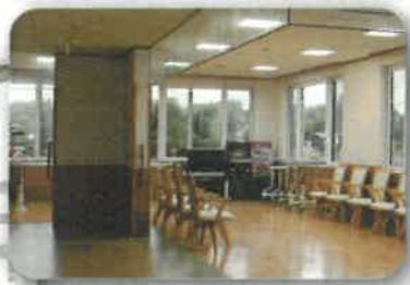
機能訓練コーナー