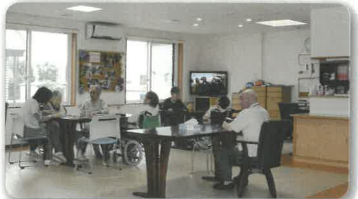
ユニット共同生活室