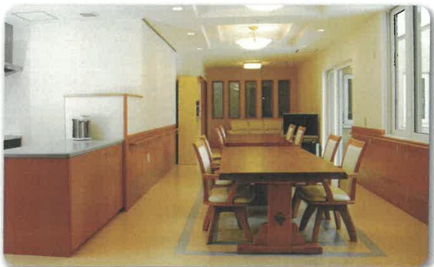
ユニット共同生活室