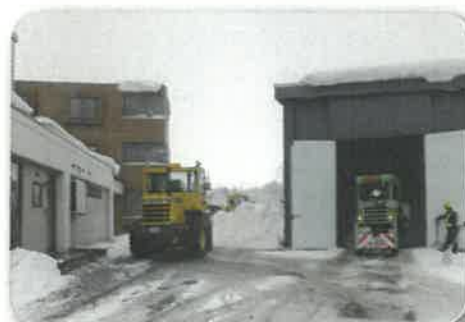
貯蔵庫への雪入れ作業