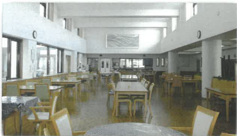
雪冷房が導入されている食堂と談話コーナー

ケアハウス・ハーモニーは、快適な生活環境のため、新エネルギーである『雪氷冷熱エネルギー』を活用しました。