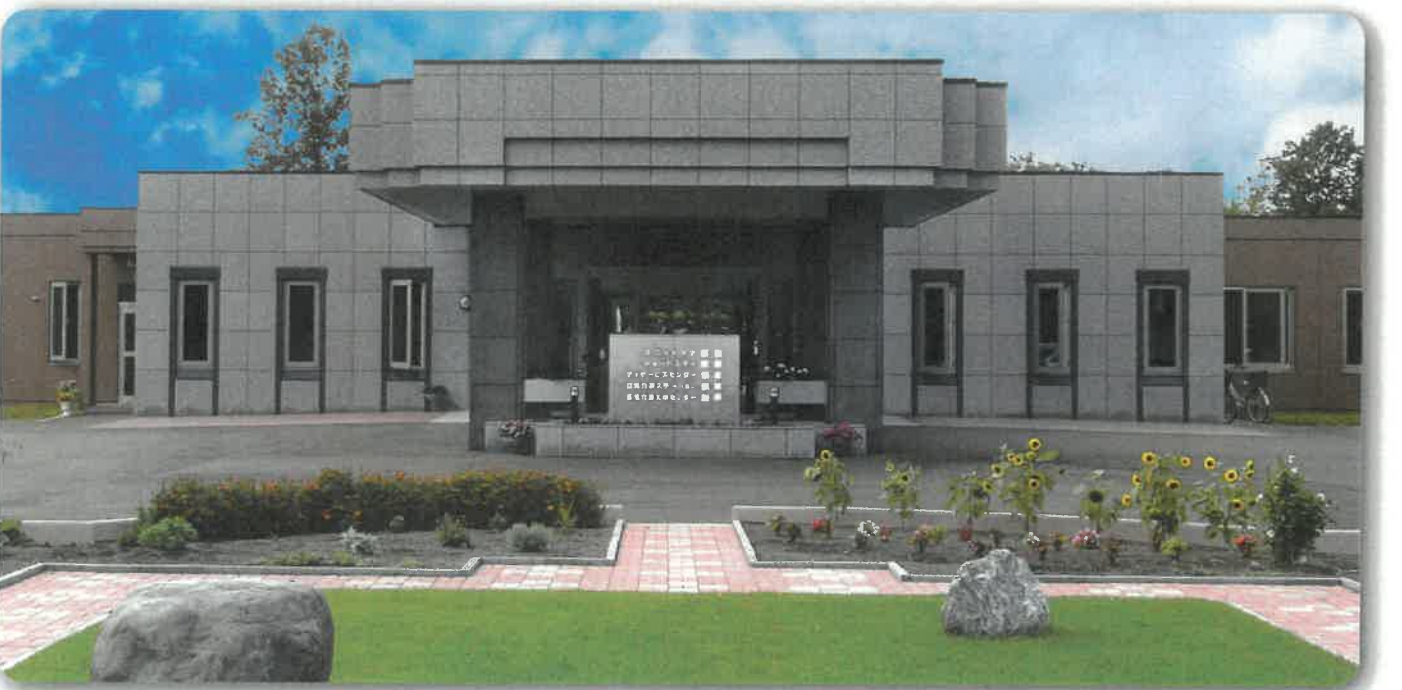
特別養護老人ホーム 泰康 全景（北海道福祉のまちづくりコンクール 優秀賞受賞）