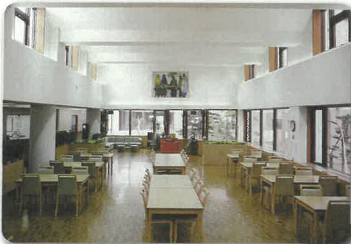
食堂と談話コーナー