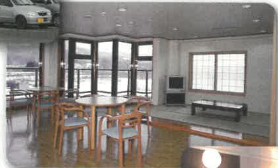
▲各階の談話コーナー