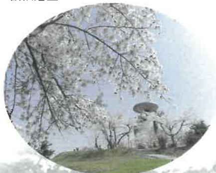
東明公園のさくら