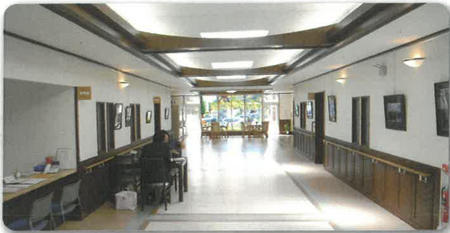
ロビーとスタンドグラス

要支援1・2、要介護1～5の認定を受けている方で、ご家庭の諸事情により、一時的に介護できなくなった場合のショートステイを行っています。サービス内容は特別養護老人ホームと同じです。また利用時の送迎も行っています。