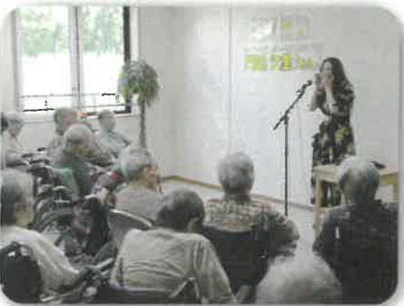
多目的ホールでの行事